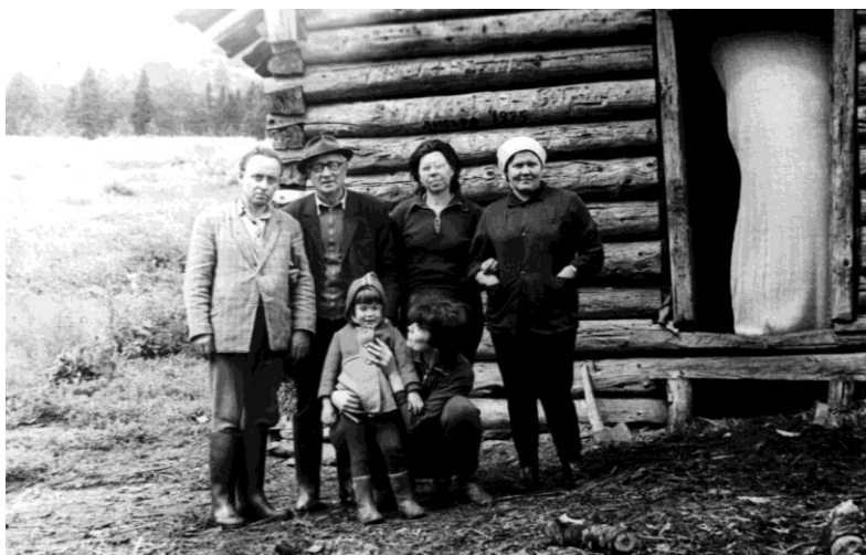
Поход на Южный Басег. 1975 год.

Июнь 1970 года, я вёл группу туристов работников ППЖТ на станцию Паленый Лог, на братскую могилу погибших во время Гражданской войны красноармейцев с бронепоезда №2. Пешком мы прошли от Кусьи через Осиновку, Бедьку, Чизму на станцию Кумыш. Затем по железной дороге добирались до Лысьвы. За 5 дней были в поселке Осиновка, на кордоне Бедька, в поселке Чизма. Чизма - красивое, живописное место на берегу реки Чусовой. В этот старый поселок ссылали репрессированных. Здесь работала бригада сплавщиков. В Пермской области продолжали сплавлять лес по реке Чусовой, хотя в Свердловской области сплав был давно запрещен. Ночевали мы в полуразвалившейся начальной школе. В это время на Чизме жили восемь человек. У лесника Алексея Пирожкова был даже телевизор на батарейках. Поселка сейчас уже нет. В последний раз я видел сгоревшее дотла поселение.