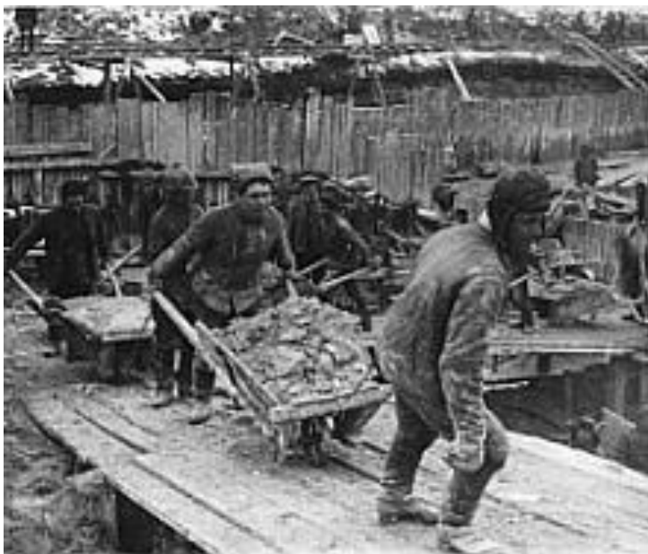
Работа политзаключенных в лагерях Пермской области. 30-е годы XX века