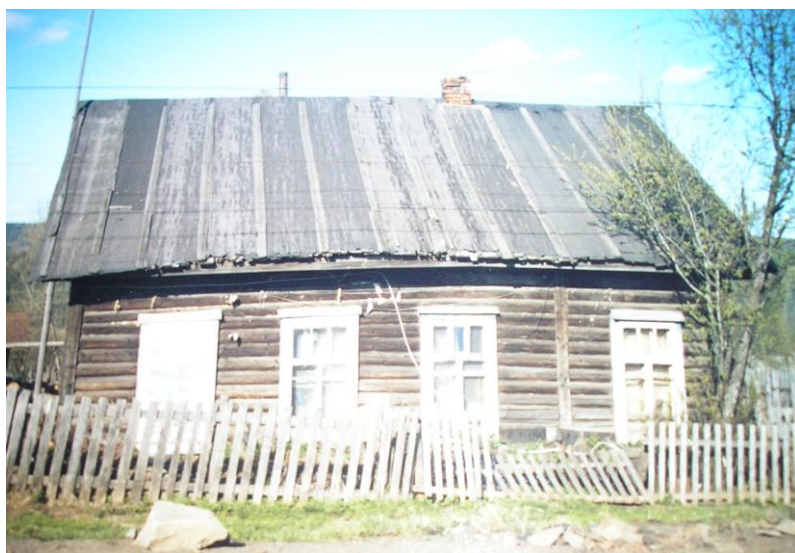
Поселок Теплая Гора. В этом здании в 30-е годы XX века была комендатура.

И на местах ссылки им не давали покоя, часто арестовывали и