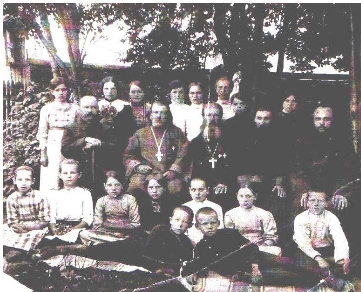
Кусье-Александровская церковь. Певчие 1906 г.

В 1937 году была закрыта Богородицкая церковь в поселке Кусье-Александровский. Были разрушены храм в поселке Бисер и часовня в поселке Теплая Гора.