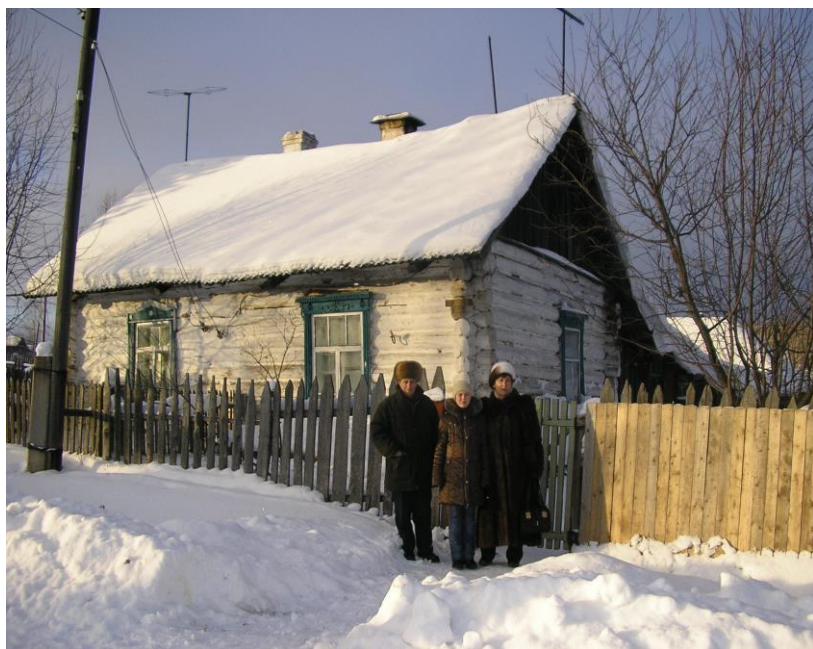
Дом № 7 по улице Октябрьской в поселке Теплая Гора.

С 1935 года началась постепенная реабилитация спецпереселенцев. Моим родным повезло. Их реабилитировали одними из первых. С целью закрепления рабочей силы на Урале, в Теплой Горе в 1936 году началось строительство поселка за рекой Нижний Еловик. На месте застройки стоял сплошной лес, который люди сами вырубали. Бревна рубили в свободное от работы время в спецпоселках. По реке Койва сплавляли бревна до Теплой Горы, где их вылавливали. Леспромхоз силами спецпереселенцев строил дома на два хозяина. Таким