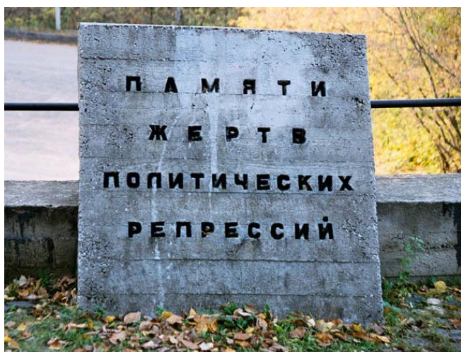
Памятник на Егошихенском кладбище. Город Пермь.

Со смертью Сталина 5 марта 1953 года началось изменение политической системы СССР. Амнистия от 27 марта 1953 года освободила 1,2 млн. человек. Было прекращено «дело врачей». В 1954 году реабилитированы жертвы «ленинградского дела», в ноябре 1955 года - Еврейского антифашистского комитета. Были освобождены и реабилитированы арестованные после войны военачальники, положено начало пересмотру политических обвинений 30-х годов. Всего до начала 1956 года только военной коллегией Верховного суда СССР реабилитировано 7,5 тысяч человек. За период 1956-1961 годы было реабилитировано почти 700 тысяч человек (т.е. в 100 раз больше, чем за 1953-1955 годы). В январе 1957 года Верховный Совет СССР восстановил национальную государственность балкарского, ингушского, калмыцкого, карачаевского, чеченского народов. Началось их возвращение на историческую родину. По данным Государственного общественно-политического архива Пермской области (ГОПАПО) от 20 октября 2006 года репрессированных граждан в Горнозаводском районе было 593 человека.