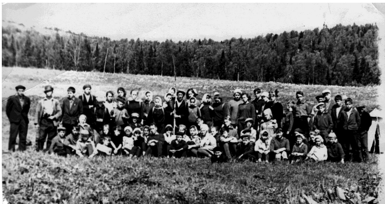
На Южном Басеге встретились школьники Саранов, Пашии, и Горнозаводска (июнь 1966 г.)

1965 год - спецпоселение Песчанка - квартал № 43. Уже в те годы он был разрушен до основания. В тот же 1965 год посетили мы Южный Басег. В полуразрушенном поселке остались остовы двух огромных конюшен для лошадей. Жителей мы в нем не встречали.