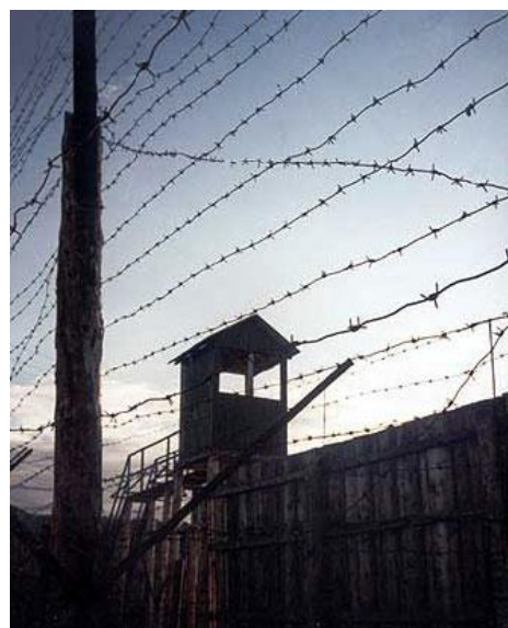
Лагерь политзаключенных «Пермь-36»

Всему миру печально известен так называемый «Пермский треугольник», в который входили политзоны «Пермь-35, 36, 37». Известны они тем, что в них коммунистический режим в 70-80-е и вплоть до 1992 года изолировал инакомыслящих. Инакомыслие расценивалось как преступление, более опасное, чем уголовное. По инициативе политзаключенных мордовских и пермских лагерей 30 октября (1974г.) был объявлен днем советского политзаключенного. С тех пор отмечается регулярно.