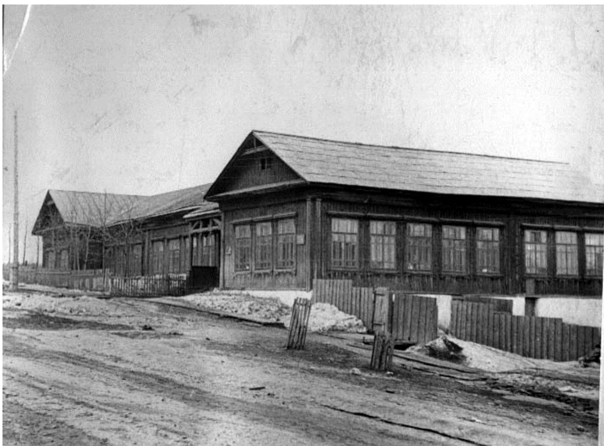
Архангело-Пашийское двухклассное мужское училище. Построено в 1910 г.

Строились небольшие школы и в рудничных поселках. Например, в 1895 году было одноклассное училище в поселке Зыковского рудника, где обучалось до 30 учеников, и был один учитель П.П. Липин.