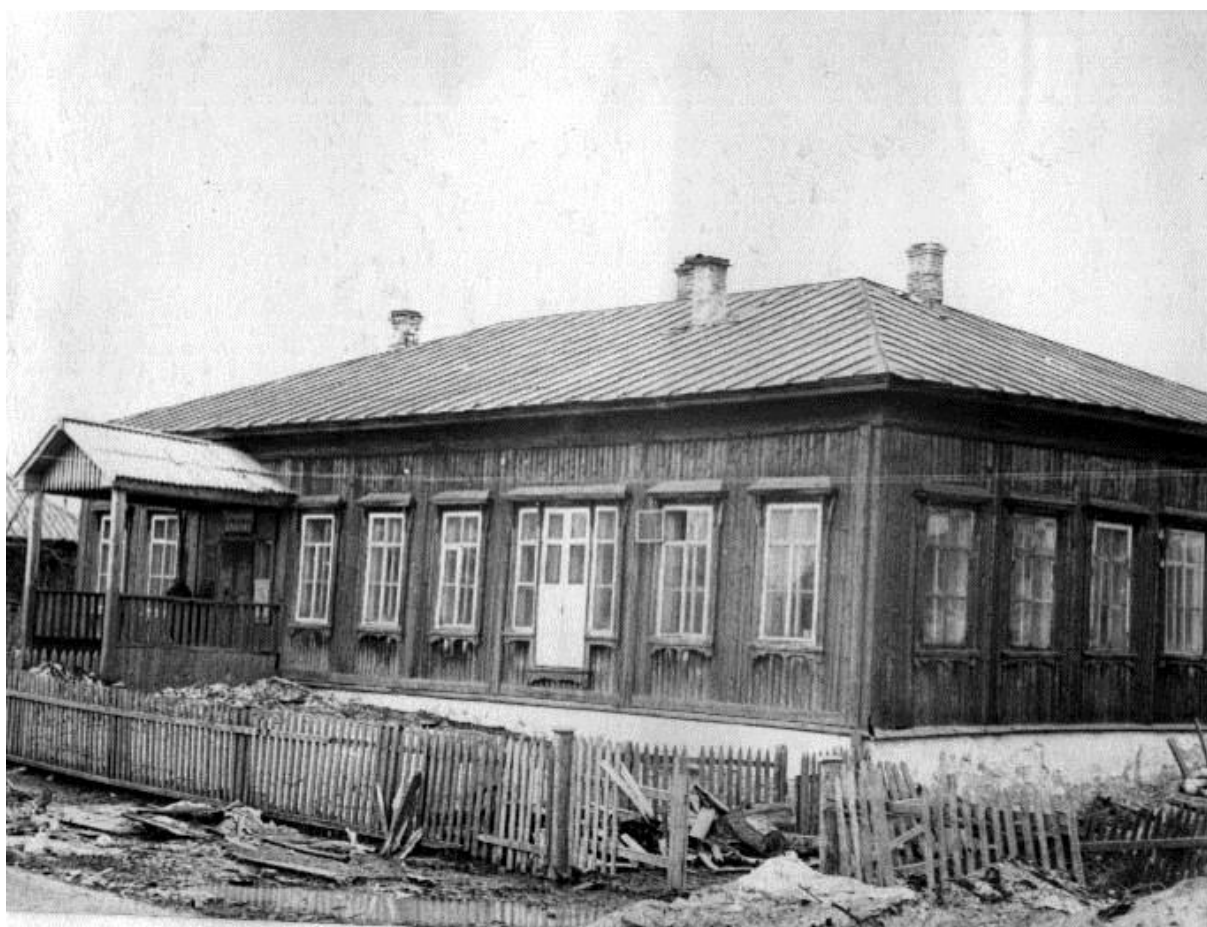
Архангело-Пашийское начальное женское народное училище, «женская» школа. Построена в 1894 г.

В 1895-1896 годах строится новое здание для мужского двухклассного училища «мужская» школа. В 1907 году оно сгорело, и несколько лет мальчики и девочки обучались вместе в «женской» школе пока было выстроено новое здание «мужской» школы в 1909-1910 годах.