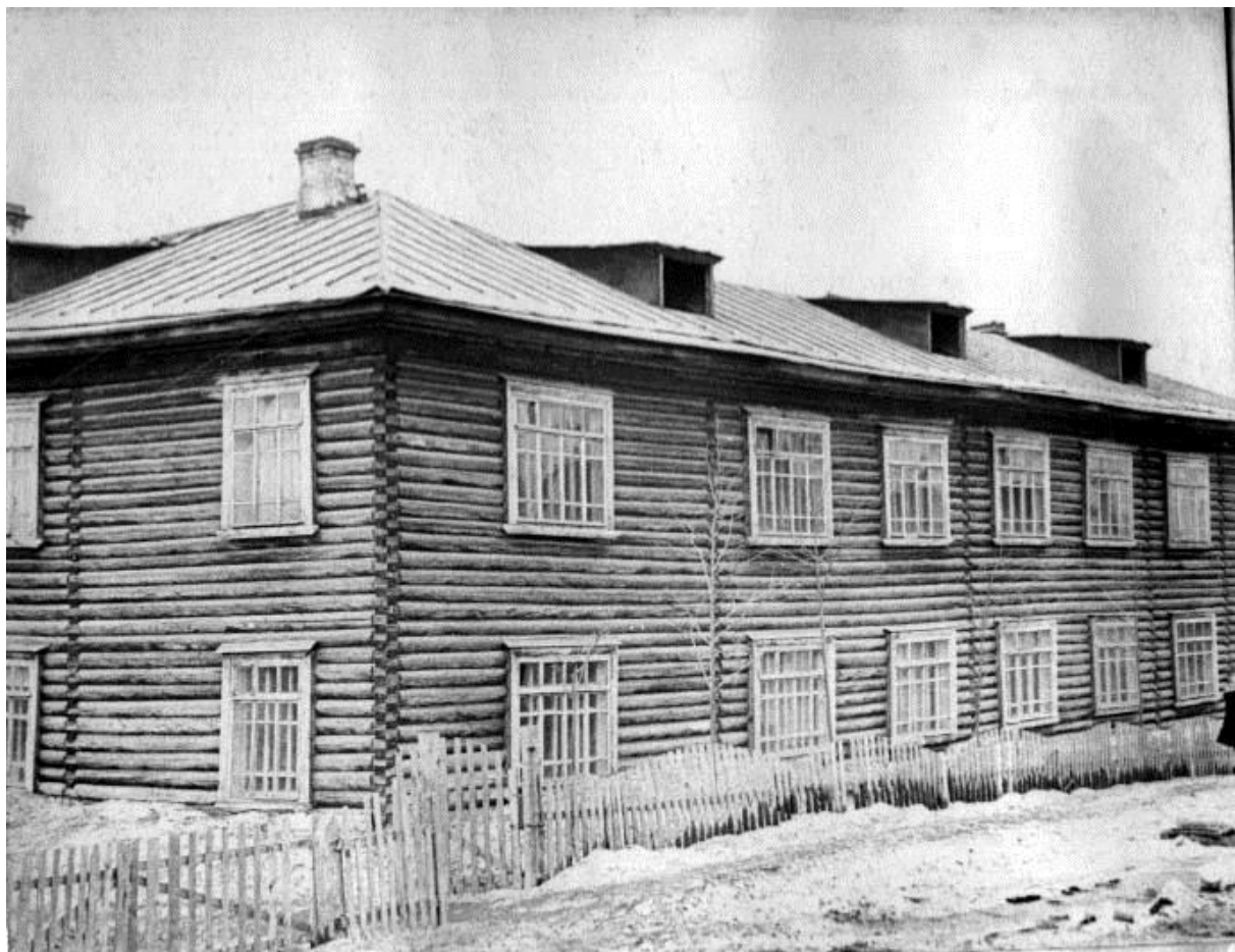
Здание начальной школы. Построено в 1934 году.