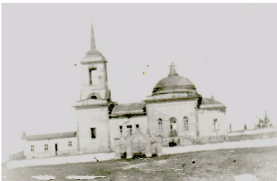
Церковь Кусье-Александровского завода.