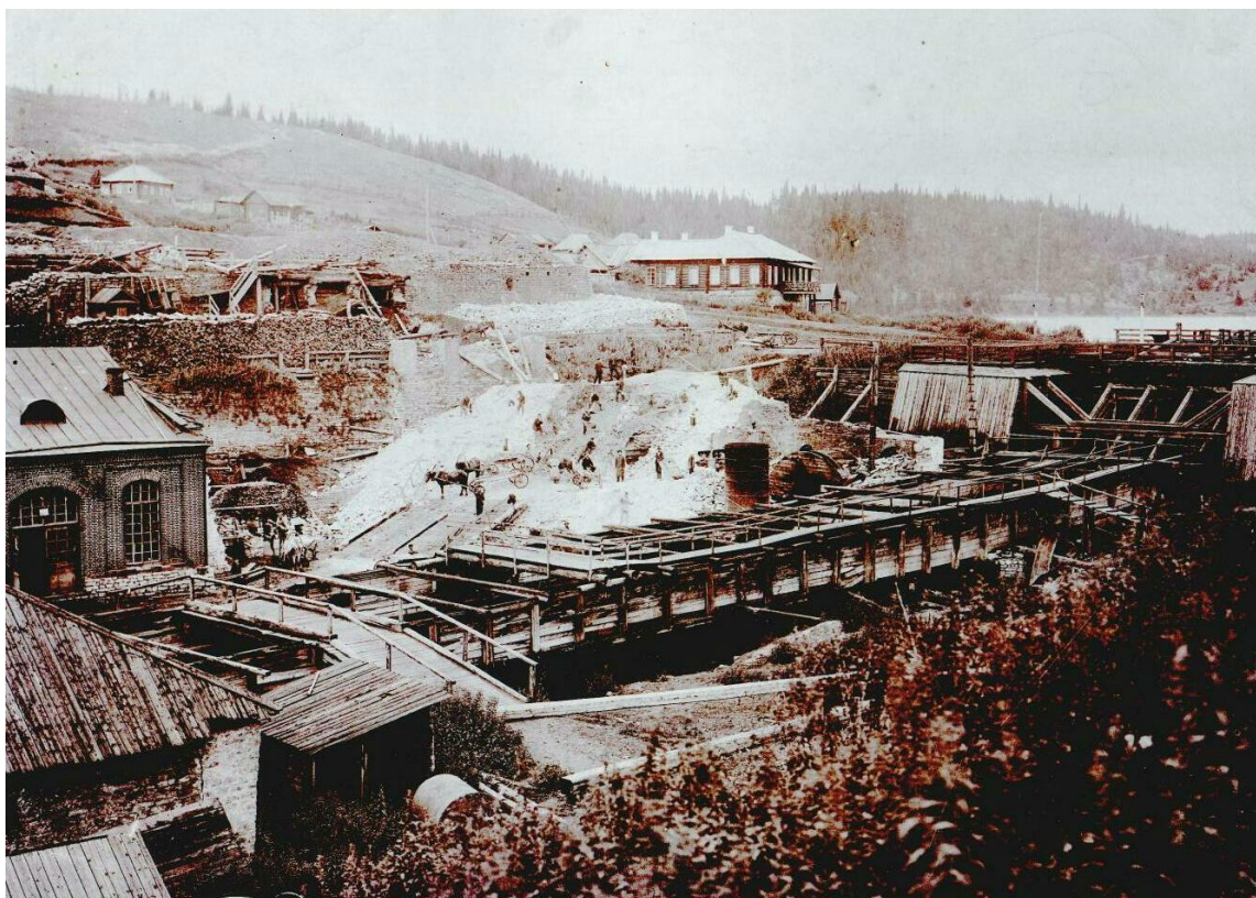
Плотина Кусье-Александровского завода.

Руда добывалась на многочисленных рудниках в 8-15 километрах от завода. Работали рудники Графский, Осиновский, Троицкий, Куртымский, Койвинский и другие. Самым значительным из них был Куртымский рудник, действовавший 130 лет. В 1912 году рудник отмечал свое 125-летие. В июле 1918 года даже существовал Куртымский Совет рабочих депутатов.