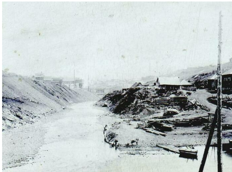
Устье р. Кусья