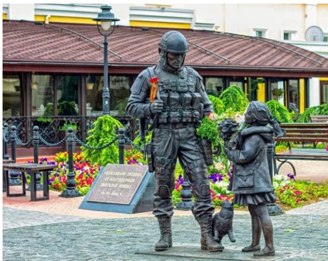
«Вежливые люди» стали мемом и брендом