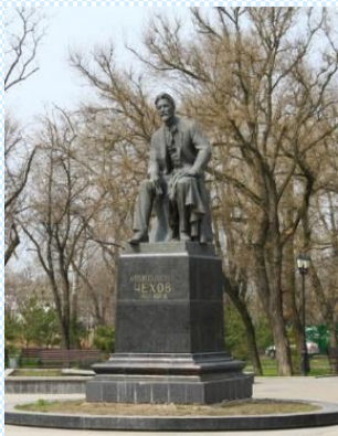
Скульптор И. М. Рукавишников. 1960

Город Таганрог – родина великого русского писателя Антона Павловича Чехова - помнит и чтит его не только в многочисленных музеях и памятниках незаурядной и знаменитой личности, но и в памятниках его литературным героям.