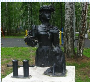
«Дама с собачкой»

В парке был установлен бюст писателя и скульптуры «Дама с собачкой», «Три сестры», «Ванька Жуков»