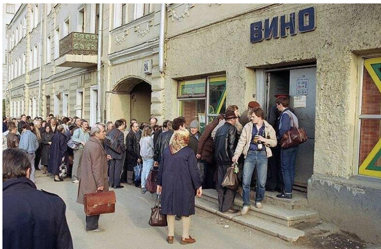
Очереди в магазины за спиртным были все рекорды

Самая активная фаза кампании пришлась с 1985 по 1987 годы. Будет объявлено, что благодаря таким действиям удалось предотвратить более миллиона смертей. На деле производство спиртных напитков сократилось вдвое, а выпуск винной продукции был урезан на две трети. Но все эти акции по борьбе с пьянством негативно сказались на населении. Прежде всего, резко выросла спекуляция, многократно увеличился спрос на сахар и другие товары, среди которых была и зубная паста, и одеколон, и прочие спиртосодержащие продукты. В спекуляции обвинялся каждый десятый работник из сферы торговли, а к ответственности за нарушение продажи спиртного было привлечено более 60 тысяч человек.