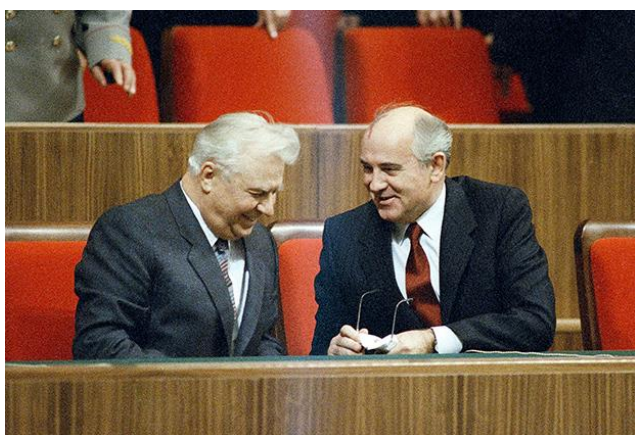
Михаил Горбачев вместе с Егором Лигачевым — одним из вдохновителей кампании

Но наибольшую известность получила кампания, инициированная Михаилом Горбачевым. Придя к власти, генеральный секретарь понимал, что потребление алкоголя стало массовым. Это прекрасно понимал не только новоиспеченный глава СССР, но и Егор Лигачев вместе с Михаилом Соломенцевым, которые стали идейными вдохновителями этой кампании.