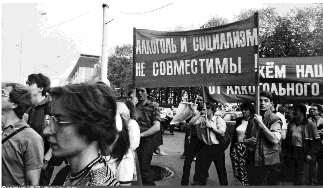
Во время одного из антиалкогольных митингов