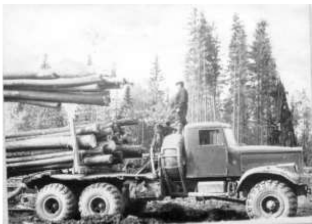
Гулый Г. П. на своём лесовозе под погрузкой

В гараж поступили первые лесовозы на шасси МАЗ-501.