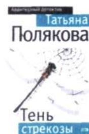
Татьяна Полякова Тень стрекозы

Полякова, Татьяна. Тень стрекозы / Татьяна Полякова. — Москва : Эксмо, 2005. — 349с. — (Авантюрный детектив).