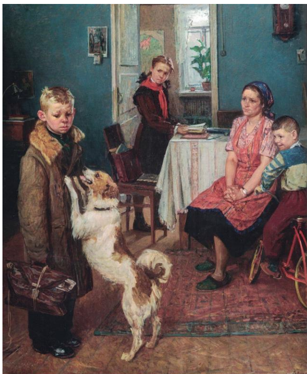
▲ Фёдор Решетников. Опять двойка. 1952