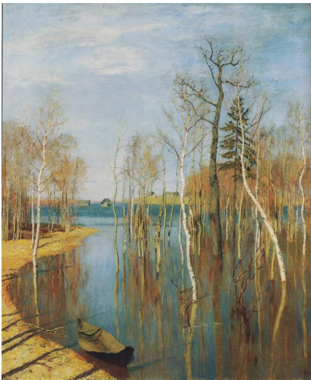
▲ Исаак Левитан. Весна. Большая вода. 1897